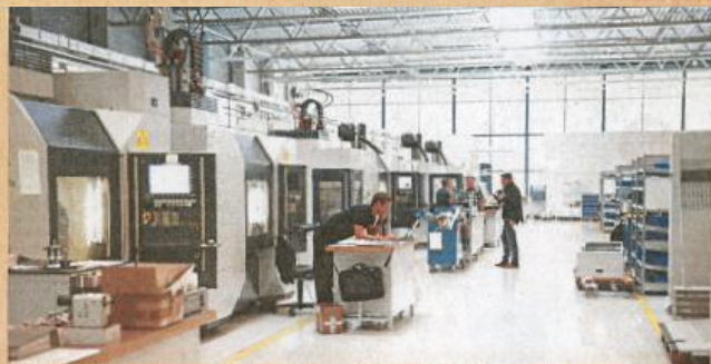
Ein Blick in die neue Fertigungshalle, die Haas Ende November 2013 bezogen hat.